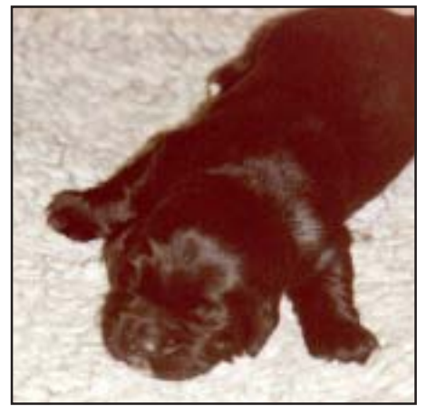
De første dagene ligger valpen på magen og åler seg fram ved å bevege samtidig bena på hver side av kroppen (krabber i passgang - "pass-krabb"). De neuromuskulære ferdighetene utvikles raskt, og etter noen uker beveger den seg både raskt og uhemmet.

på ingen måte det samme som at valpen nå kan se. Synsevnen utvikles gradvis og over lang tid. Man antar at den sannsynligvis ikke er fullt utviklet før valpen er flere måneder gammel (BV Beaver). Men allerede før øyelokkene åpnes, mener man at valpen har en viss grad av beskyttende reflekser både når det gjelder lysblink og øyelokkrefleks. Dette er en hjelp til å beskytte øyet både mot skarpt lys og støt, men er på langt nær like godt utviklet som hos en voksen hund. Fra øynene begynner å åpnes til valpen er over 3 uker gammel bør man derfor unngå kraftig lys som for eksempel blitzlys rett i øynene.