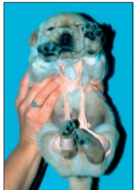
Ikke alle valper kommer seg på bena ved egen hjelp. Det gjelder spesielt store og tjukke valper i små kull. Disse har god hjelp av taping ved at man lager en slags sele. Etter få dager med en slik sele vil disse valpene være i stand til å gå på egenhånd.

Et dempende signal er en bevisst handling. Slike signaler brukes som en reaksjon på noe, for å unngå provokasjon, vise underdanighet eller løse opp en truende eller ubehagelig situasjon.